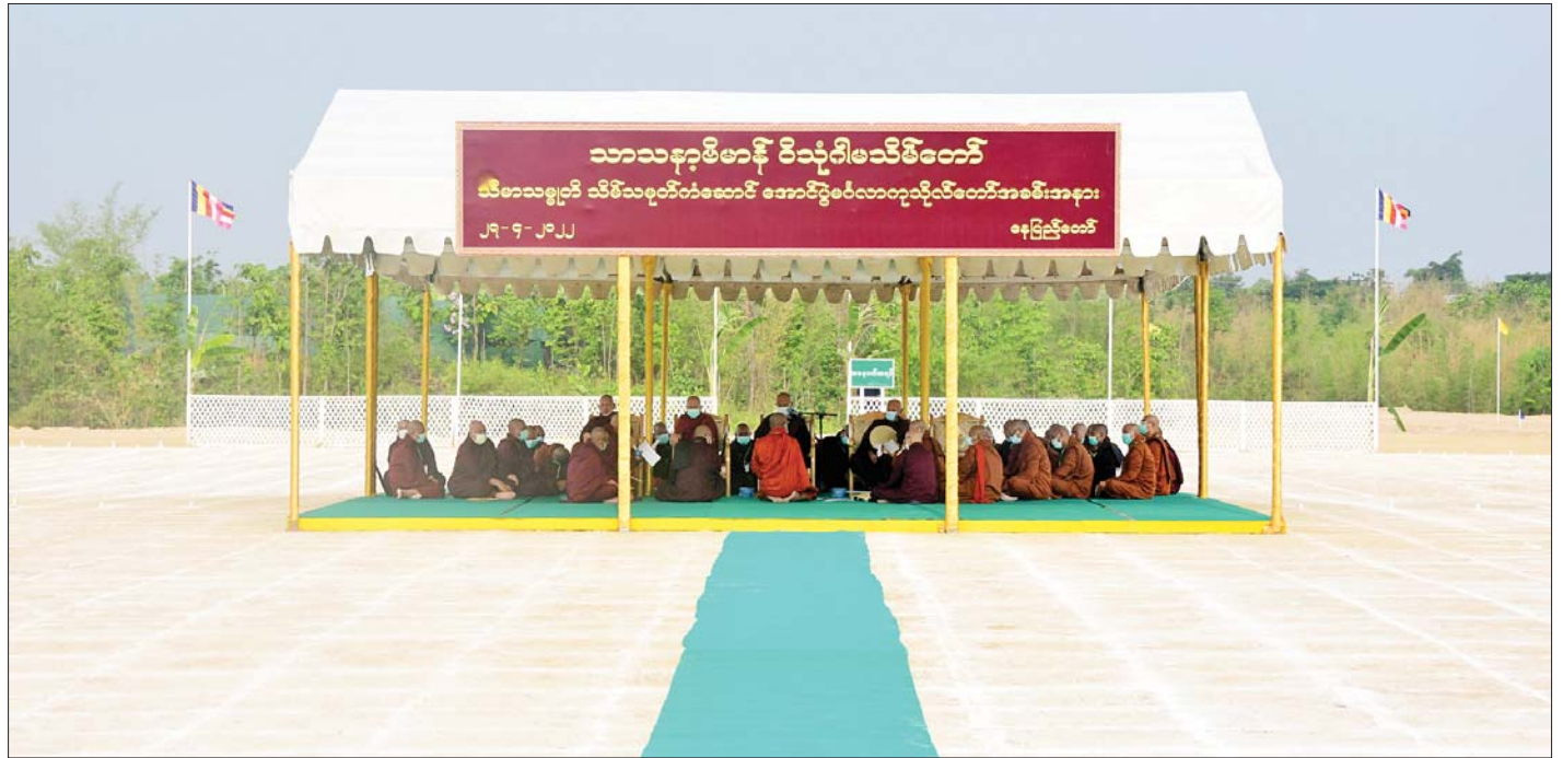
မာရဝိဇယဗုဒ္ဓဥယျာဉ်တော်ဝတ္ထုကံတော်အတွင်း သံဃာတော်များက ဝိသုဂါမသီမာသမ္ဗုတိ သိမ်သမုတိကံဆောင်ခြင်းကို ဆောင်ရွက်တော်မူကြသည်။

ဦးစွာ သံဃာတော်များက ဝိသုဂါမသီမာသမ္ဗုတိ သိမ်သမုတိကံဆောင်ခြင်းအား ဝိနယဥပဒေသများ နှင့် လျော်ညီစွာ ဆရာထေရ်စဉ်ဆက်တို့၏ ဩဝါဒများ နှင့်အညီ ဆောင်ရွက်တော်မူကြသည်။