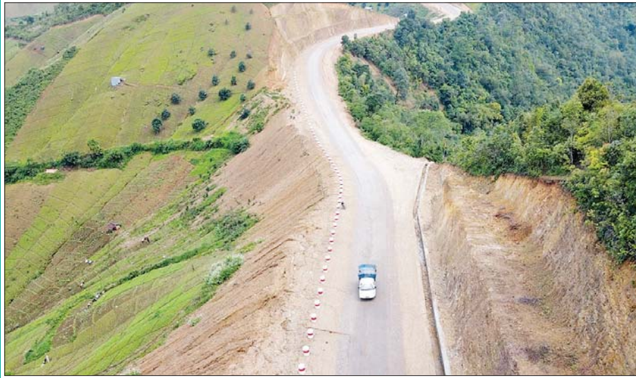
ကျောက်တန်း- ဖက်နမ်- ပင်လုံလမ်း (၃ ဒသမ ၆၆ မီတာ) ကတ္တရာခင်းခြင်းလုပ်ငန်း ဆောင်ရွက်ပြီးစီးမှုကို တွေ့ရစဉ်။

၆ ရှမ်းပြည်နယ်တောင်ပိုင်း လမ်းဦးစီးဌာနသည် ပြည်ထောင်စုမှ စီမံခန့်ခွဲလျက်ရှိသည့် လမ်း ကိုးလမ်း လမ်းမိုင်အရှည် ၇၉၇ မိုင် သည် ဒသမ ၅ ဖာလုံ၊ ပြည်နယ်မှ စီမံခန့်ခွဲလျက်ရှိသည့် လမ်း ၆၂ လမ်း လမ်းမိုင်အရှည် ၁၆၈၇ မိုင် ၇ ဒသမ ၅ ဖာလုံကို တာဝန်ယူဆောင်ရွက်