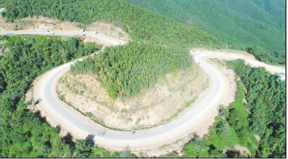
ဟံမြင့်မိုရ်- မြို့ကြီး- အောင်ပန်းလမ်း ကတ္တရာလမ်း အဆင့်မြှင့်တင်ခြင်းလုပ်ငန်း ဆောင်ရွက်ထားမှုကို တွေ့ရစဉ်။

ခရိုင် သုံးခရိုင်၊ မြို့နယ် ၂၁ မြို့နယ် ဖွဲ့စည်းထားသော ရှမ်းပြည်နယ်တောင်ပိုင်းရှိ ပြည်သူများ၏ လူမှုစီးပွားဘဝတိုးတက်လာစေရန်အတွက် အခြေခံကျသည့် လမ်းကွန်ရက်များကို ရှမ်းပြည်နယ်တောင်ပိုင်း လမ်းဦးစီးဌာနမှ ဘဏ္ဍာနှစ်အလိုက် အကောင်အထည်ဖော် ဆောင်ရွက်သွားမည် ဖြစ်သည်။ ထိုသို့ ပြည်သူ့အတွက် ဆောင်ရွက်ရာတွင် ဦးစီးဌာနက ချမှတ်ထားသော လုပ်ငန်းစဉ်များနှင့်အညီ အရည်အသွေးပြည့်မီသော လမ်းလုပ်ငန်းများ ဖြစ်စေရန်အတွက်လည်း ကြိုးပမ်းဖော်ဆောင် နေမည်ဖြစ်ပါကြောင်း ရေးသားတင်ပြလိုက်ရပါသည်။ ။