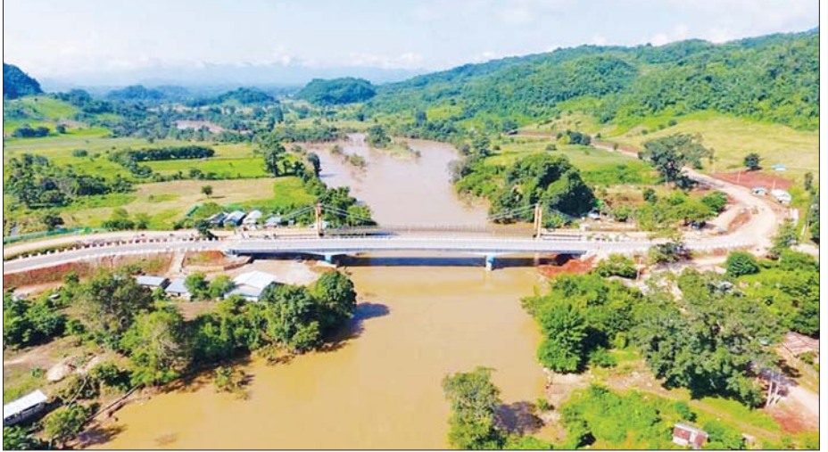
လဲချား- မိုင်းနောင်- မိုင်းရှူး- မိုင်းကောင်လမ်းပေါ်ရှိ နမ့်ပန်ချောင်းတံတားကို တွေ့ရစဉ်။