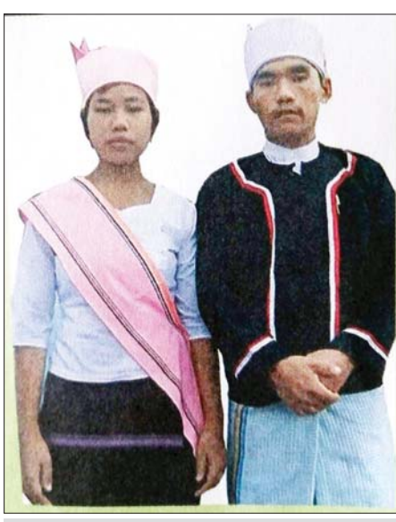
“မြို့”တိုင်းရင်းသား အမျိုးသားနှင့် အမျိုးသမီး။

စေလျက် လူပျိုလှည့်ရန်အတွက် အပျိုအိမ်သို့သွား ကြရသည်။ တစ်ရပ်တစ်ကျေးမှ လူပျိုလှည့်ရန် လာရောက်ကြသော ဧည့်သည်လူပျိုတို့ကမူ ရွာခံ ကာလသားခေါင်းကို အရက်တစ်ပုလင်း လက်ဆောင် ပေးပြီးမှ လူပျိုလှည့်ခွင့် တောင်းခံကြရသည်။ သမီးရှင်မိဘများသည် မိမိ၏သမီးကကြိုက် သည်ဖြစ်စေ၊ မကြိုက်သည်ဖြစ်စေ အိမ်သို့ ရောက်လာကြသော လူပျိုများကို သဘောထားကြီး စွာဖြင့် လူပျိုလှည့်ခွင့်ပေးကြရသည်။ “မြို့”တိုင်းရင်းသားသွေးချင်း မိန်းမပျိုလေး များသည် အချစ်ရေးနှင့်ပတ်သက်လာလျှင် ရိုးသား ပွင့်လင်းကြသည်။ မူယာမာယာများလေ့မရှိကြပေ။ လူပျိုလှည့်ရန် လာရောက်ကြသူတို့သည် “ပလုံ”ခေါ် ဘူးသီးခြောက်ပလွေနှင့် တိန်တောင်ခေါ် ဝါးလုံးတွင် ကြိုးတပ်ထားသည့် စောင်းတူရိယာ တစ်မျိုးကို ယူဆောင်လာတတ်ကြသည်။ ထိုတူရိယာ ကို တီးမှုတ်၍ အချစ်သီချင်းများ သီကျူးကာ အပျိုကို ချစ်ရေးမြို့လေ့ရှိကြကြောင်း သိရသည်။ “မြို့” တိုင်းရင်းသားသွေးချင်း မိန်းမပျိုလေး များသည် မိမိက ချစ်ကြိုက်လျှင် ချစ်ကြိုက်ကြောင်း၊ ချစ်ရေးဆိုသူ၏ အချစ်ကိုလက်ခံကြောင်း ပွင့်လင်း စွာပင် တုံ့ပြန်ပြောဆိုတတ်ကြသည်။ ချစ်သူဘဝသို့ ကူးပြောင်းသွားပြီဖြစ်သော အကြင်မောင်မယ်နှစ်ဦးတို့သည် အများမျက်ကွယ် နေရာတွင် ချိန်းဆိုတွေ့ဆုံကြလျှင် တစ်ဦး၏ ပေါင်ပေါ်တွင် တစ်ဦးက ဦးခေါင်းတင်ကာ မျက်ခုံး မွှေးများကို အပြန်အလှန် နုတ်ပေးလေ့ရှိကြသည်။ မျက်ခုံးမွှေးနုတ်ထားသော အပျိုလူပျိုတို့ကို