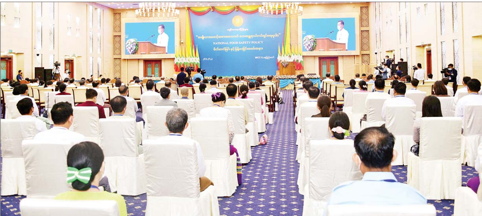
နိုင်ငံတော်စီမံအုပ်ချုပ်ရေးကောင်စီ ဒုတိယဥက္ကဋ္ဌ ဒုတိယဝန်ကြီးချုပ် ဒုတိယဗိုလ်ချုပ်မှူးကြီး စိုးဝင်း အမျိုးသားအဆင့် အစားအသောက်ဘေးအန္တရာယ်ကင်းရှင်းရေးမူဝါဒ မိတ်ဆက်ခြင်းနှင့် ဖြန့်ဝေခြင်းအခမ်းအနားတွင် အမှာစကားပြောကြားစဉ်။

နေပြည်တော် ဧပြီ ၂၇ အမျိုးသားအဆင့် အစားအသောက်ဘေးအန္တရာယ်ကင်းရှင်းရေးမူဝါဒ မိတ်ဆက်ခြင်းနှင့် ဖြန့်ဝေခြင်းအခမ်းအနားကို ယနေ့နံနက် ၉ နာရီတွင် နေပြည်တော်ရှိ မြန်မာအပြည်ပြည်ဆိုင်ရာ ကွန်ဗင်းရှင်းဗဟိုဌာန-၂ ၌ ကျင်းပရာ နိုင်ငံတော် စီမံအုပ်ချုပ်ရေးကောင်စီ ဒုတိယဥက္ကဋ္ဌ ဒုတိယဝန်ကြီးချုပ် ဒုတိယဗိုလ်ချုပ်မှူးကြီး စိုးဝင်း တက်ရောက်အမှာစကားပြောကြားသည်။ အခမ်းအနားသို့ နိုင်ငံတော်စီမံအုပ်ချုပ်ရေး ကောင်စီဝင်များ ဖြစ်ကြသည့် ဒေါ်အေးနုစိန်၊ ဦးမောင်းဟာနှင့် ဒုတိယဗိုလ်ချုပ်ကြီး စိုးထွဋ်၊ ပြည်ထောင်စုဝန်ကြီးများ၊ ဒုတိယဝန်ကြီးများ၊ နေပြည်တော် ကောင်စီဝင်များ၊ စာမျက်နှာ ၄ ကော်လံ ၁ သို့ ။