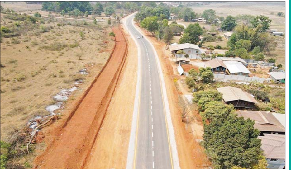
လွိုင်လင်- ပန်ကေတု- သီပေါလမ်း(လွိုင်လင်မြို့အထွက်) ကတ္တရာကွန်ကရစ်ခင်းခြင်းလုပ်ငန်း ဆောင်ရွက်ပြီးစီးမှုကို တွေ့ရစဉ်။