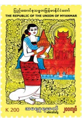
သော စာပို့တံဆိပ်ခေါင်းများပေါ်တွင် နေ့စွဲအမှတ်အသားတံဆိပ် ရိုက်နှိပ်ပေးမည်ဖြစ်ကြောင်း သိရသည်။