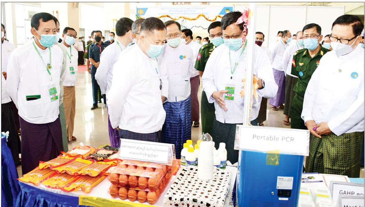
နိုင်ငံတော်စီမံအုပ်ချုပ်ရေးကောင်စီ ဒုတိယဥက္ကဋ္ဌ ဒုတိယဝန်ကြီးချုပ် ဒုတိယဗိုလ်ချုပ်မှူးကြီးစိုးဝင်းနှင့်အဖွဲ့ဝင်များ အမျိုးသားအဆင့်အစားအသောက်ဘေးအန္တရာယ်ကင်းရှင်းရေး မူဝါဒမိတ်ဆက်ခြင်းနှင့် ဖြန့်ဝေခြင်း အထိမ်းအမှတ်ပြခန်းများတွင် ခင်းကျင်းပြသထားမှုများကို လှည့်လည်ကြည့်ရှုစဉ်။

မွေးမြူရေးနှင့်ကုသရေးဦးစီးဌာနအနေဖြင့် အရည်အသွေးကောင်းမွန်ပြီး ဘေးအန္တရာယ်ကင်းရှင်းသော မွေးမြူရေးထုတ်ကုန်များအတွက် ကောင်းမွန်သည့် မွေးမြူရေးကျင့်စဉ်များကို အခြေခံ၍ စံချိန်စံညွှန်းကိုမျိုးမျိုးရေးဆွဲထားရှိကာ အကောင်အထည်ဖော်ဆောင်ရွက်လျက်ရှိကြောင်း၊ ကောင်းမွန်သည့် တိရစ္ဆာန်မွေးမြူရေးကျင့်စဉ်များကို