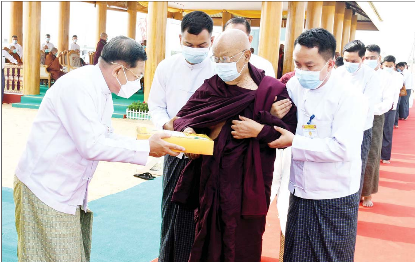
နိုင်ငံတော်စီမံအုပ်ချုပ်ရေးကောင်စီဥက္ကဋ္ဌ နိုင်ငံတော်ဝန်ကြီးချုပ် ဗိုလ်ချုပ်မှူးကြီးမင်းအောင်လှိုင် သံဃာတော်အရှင်သူမြတ်များအား လှူဖွယ်ပစ္စည်းများ လောင်းလှူစဉ်။

ယင်းနောက် သာသနာ့ဗိမာန် အဂ္ဂိမပတိဝိသု ဂါမသိမ်တော်သီမာသမ္ဗုတိ သိမ်သမုတိကံဆောင်ခြင်း အောင်ပွဲမင်္ဂလာကုသိုလ်တော် အခမ်းအနားကို နမောတဿ သုံးကြိမ်ရွတ်ဆို ဘုရားကန်တော့၍ ဖွင့်လှစ်ကြပြီး သံဃာတော်အရှင်သူမြတ်တို့က မေတ္တာပို့ဂါထာတော်များ ရွတ်ဆိုပူဇော်၍ မေတ္တာပြု ချီးမြှင့်တော်မူကြသည်။ ထို့နောက် ဘုရားဒါယကာ၊ ဒါယိကာမများက ရတနတ္ထယပူဇာဂါထာနှင့် မေတ္တာ ပို့ လင်္ကာနှစ်ပိုဒ်ကို သံပြိုင်ညီညာသုံးကြိမ်ရွတ်ဆို ပွားများပူဇော်ကြသည်။